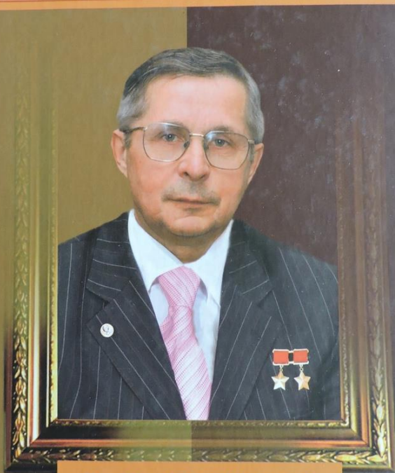
В. П. САВИНИХ

В. П. Савиных. Летчик-космонавт СССР. Ученый. Общественный деятель. - Киров : Золотой фонд Вятки, 2011. - 559 с. : ил. - (Почетные граждане города Кирова ; кн. 8).